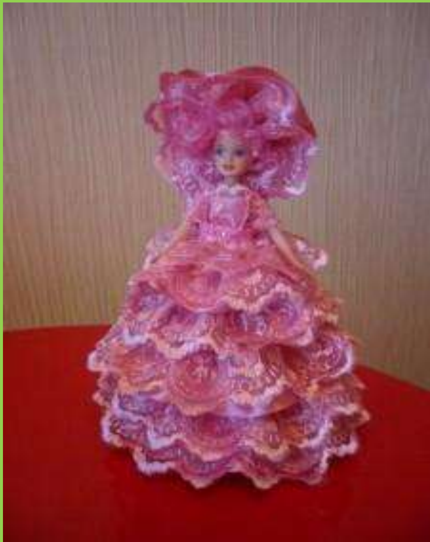
Современная кукла «Барби»